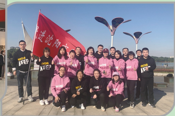
▲ 民进沈阳市委会机关参加中共市委统战部机关党委组织的健步走活动