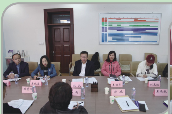
▲ 民进沈阳市委会开展2021年营商环境建设民主监督座谈