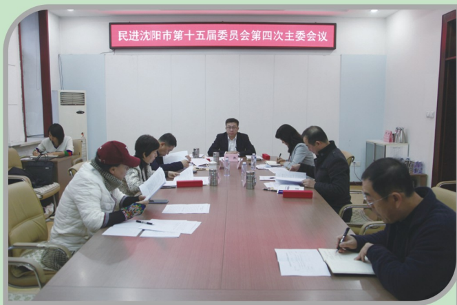
▲ 民进沈阳市委会召开十五届四次主委会