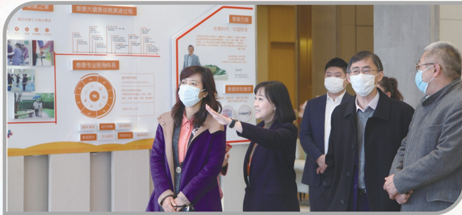
▲ 民进沈阳市委会组织部分会员深入养老机构调研