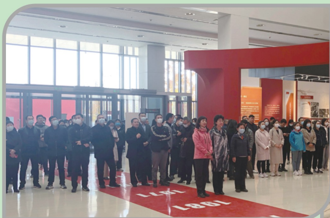
▲ 民进沈阳市委会全体机关工作人员参加民进全省机关干部培训班