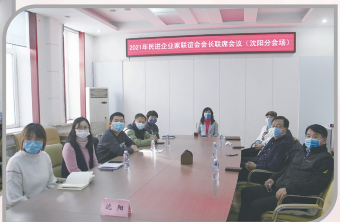
▲ 民进沈阳市委会组织收看2021年 民进企业家联谊会会长联席会议