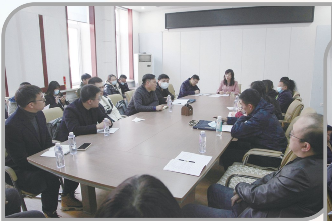
▲ 民进沈阳市委会举办2021年会友培训班