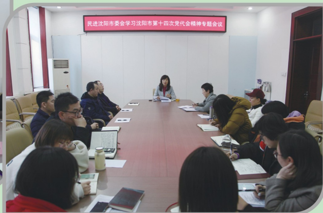
▲ 民进沈阳市委会机关学习贯彻沈阳市第十四次党代会精神