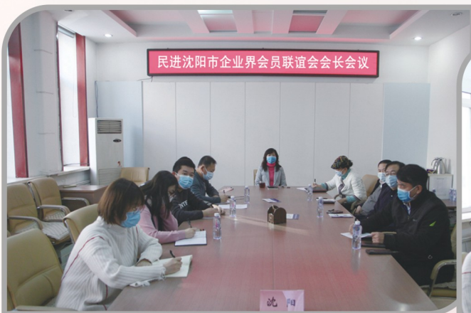
▲ 民进沈阳市企业界会员联谊会 会长会议召开