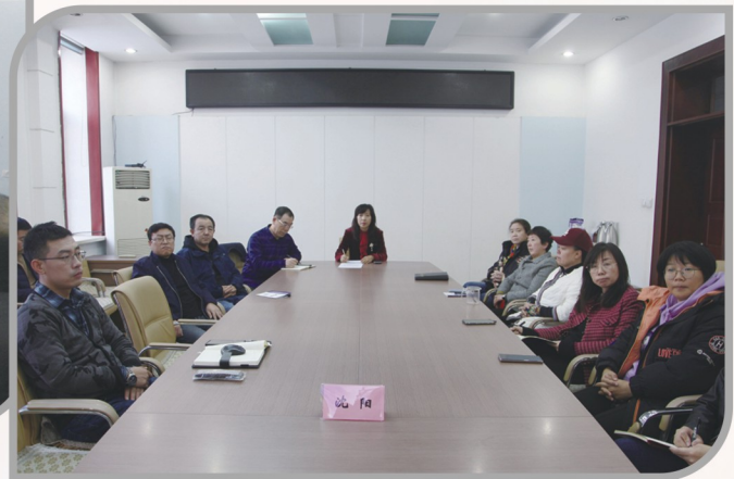
▲ 民进沈阳市委会全体机关人员收看 民进中央制度宣讲视频会议