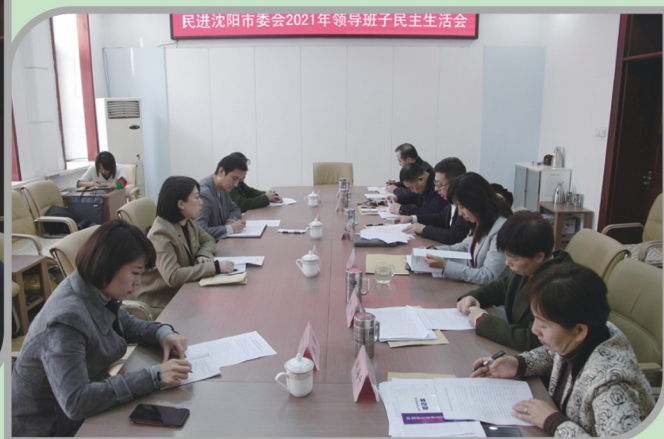
▲ 民进沈阳市委会召开2021年领导班子民主生活会