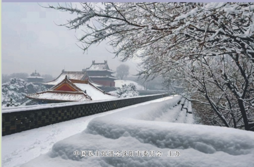
中国民主促进会沈阳市委员会 主办