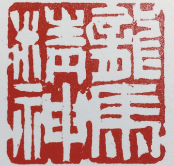
李超篆刻作品（龙马精神）