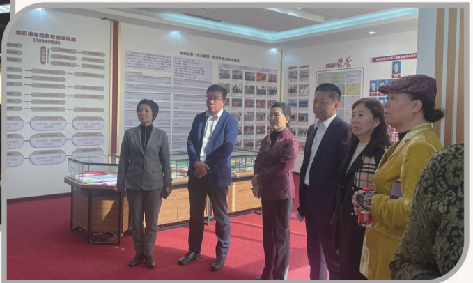
▲ 民进沈阳市委会赴大连开展基层组织发展和会员之家建设调研活动