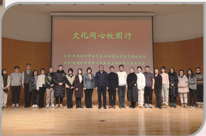
▲ 民进沈阳市委会与沈阳音乐学院联合举办“文化同心校园行”活动