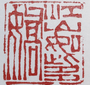
李超篆刻作品（江山如此多娇）