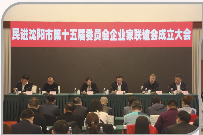
▲ 民进沈阳市第十五届委员会企业家联谊会成立