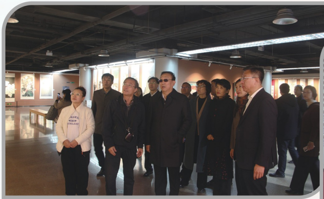
▲ 民进沈阳市委会纪念改革开放45周年美术书法摄影作品展隆重开幕