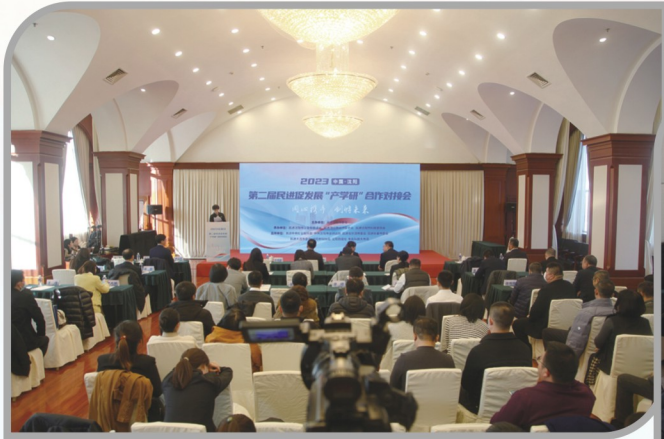
▲ 民进沈阳市委会举办第二届民进促发展“产学研”合作对接会