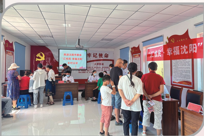
▲ 民进沈阳市委会开展乡村义诊活动