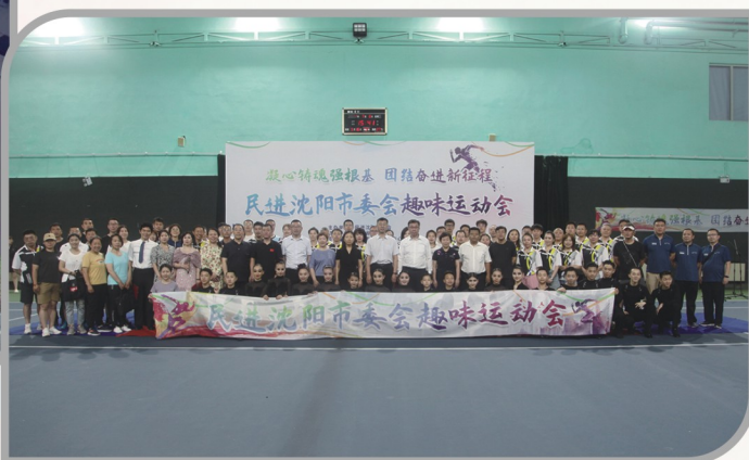
▲ 民进沈阳市委会举办“凝心聚力强根基、团结奋进新征程”主题趣味运动会