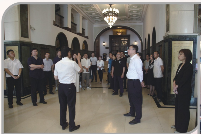
▲ 民进沈阳市第十五届委员会专门委员会成立大会召开