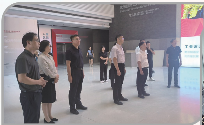
▲ 民进沈阳市委会就“未来产业发展战略规划布局”课题开展联合调研