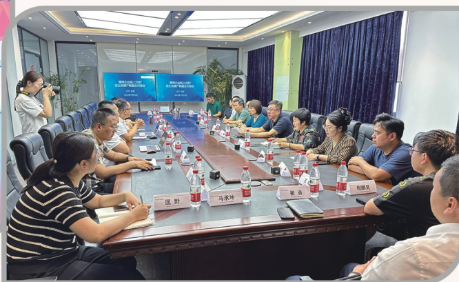
▲ 民进沈阳市委会扎实推进“领导干部进企业、服务振兴新突破”专项行动