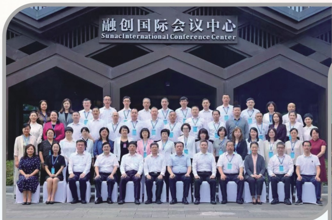
▲ 民进沈阳市委会参加民进全国副省级城市作风建设专题研讨会