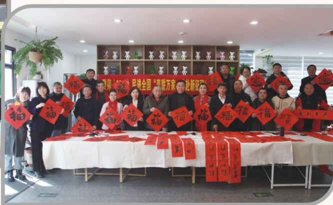
▲ 民进沈阳市委会开展“春联万家·奔赴新征程”活动