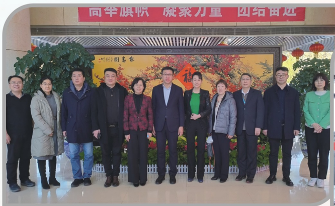
▲ 京沈两地民进组织交流座谈 致力拓展京沈合作党派新通道