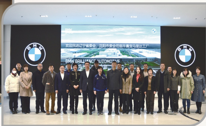
▲ 民进辽宁省委会、沈阳市委会联合开展走进头部企业调研活动