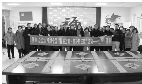
↑ 浑南区分会场 ↑