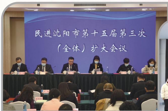
▲ 民进沈阳市委会召开十五届三次全委会