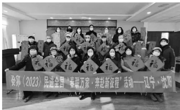
↑ 沈河区分会场 ↑

分会场分别设在沈河区、于洪区、浑南区。会员们不畏严寒,深入社区、乡村,将承载着民进人对新年幸福的春联福字送到群众手中。