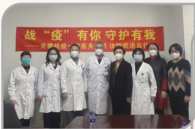
▲ 民进沈阳市委会慰问抗疫一线医务人员