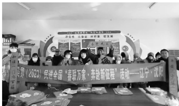
↑ 于洪区分会场 ↑